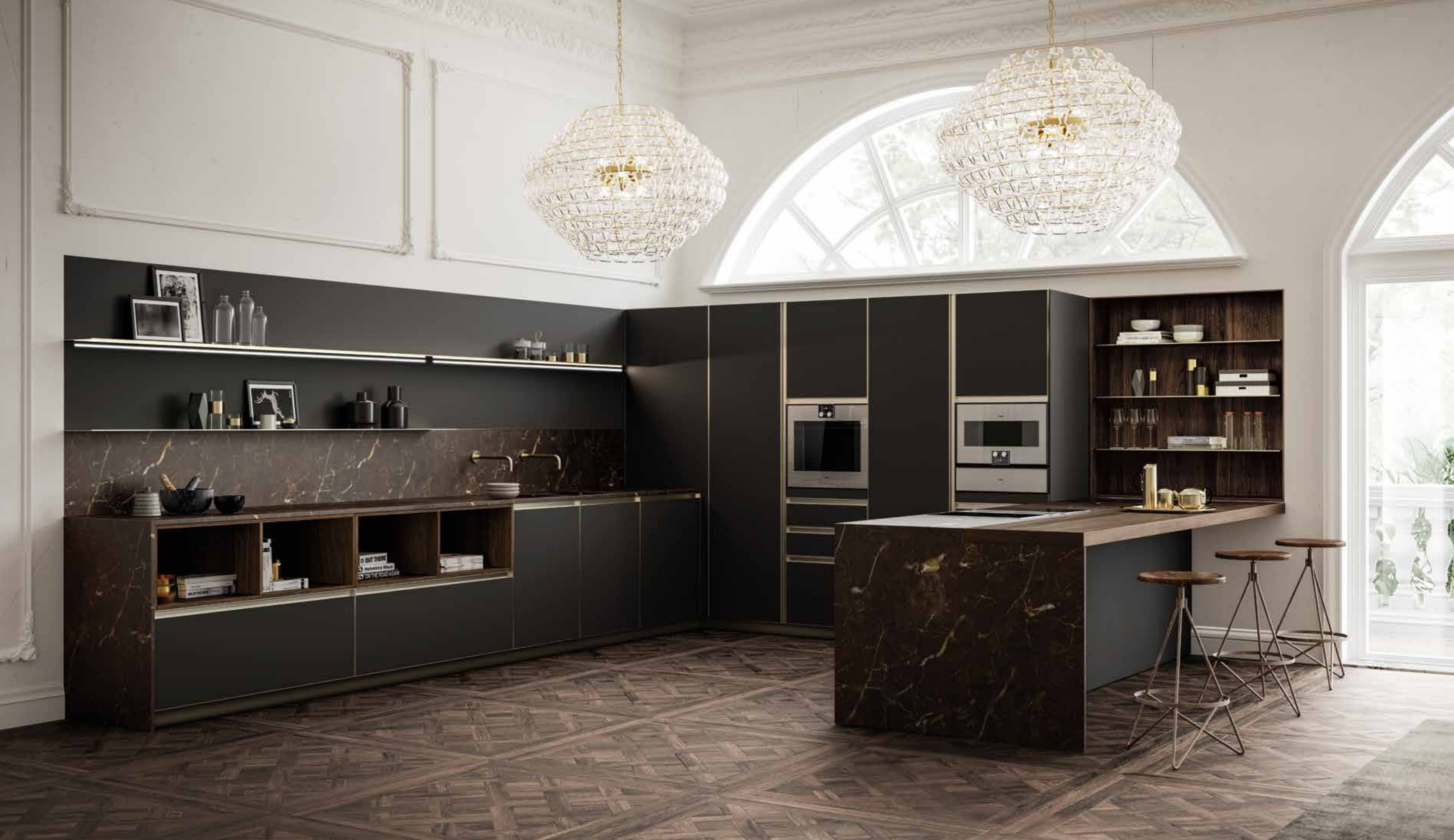
Composizione con ante in Fenix Smoking, profilo e maniglia gola in alluminio, finitura Titanio. Top in marmo Emperador Brown sp. 20 mm. Elementi a giorno in legno finitura Rovere Termizzato. Mensole in metallo sp. 3 mm finitura nero opaco.